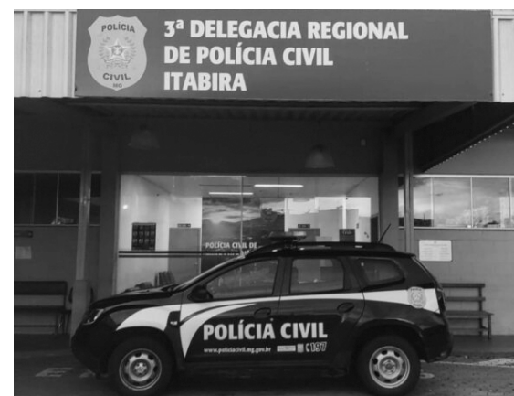
INVESTIGAÇÕES foram conduzidas pela Delegacia Especializada de Atendimento à Mulher de Itabira

A responsabilização de autores que cometem crimes desta natureza é importante para desencorajar e desestimular a prática de assédio sexual, conduta tão danosa para adolescentes", afirmou. As identidades das vítimas e do professor não foram divulgadas.