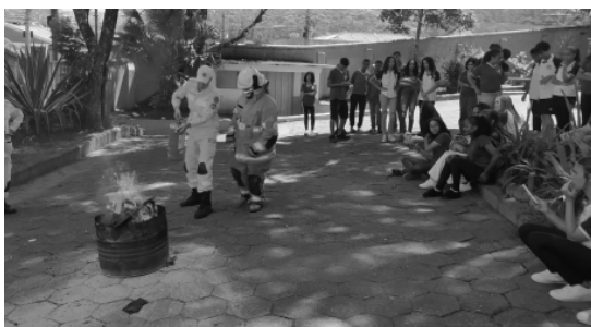
ALUNOS foram instruídos sobre como prevenir e combater incêndios

mento do fogo, as condições necessárias, os métodos de extinção das chamas e os procedimentos para evacuação. Os bombeiros realizaram demonstrações de fogo em combustíveis sólidos e líquidos, o uso de extintores em cada tipo de incêndio e as formas de abafar as labaredas. Conforme a corporação, a ação contribuiu para melhorar a pronta-resposta em emergências, aumentando a segurança coletiva.