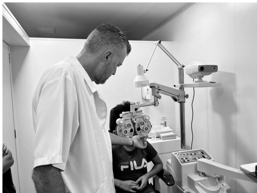
UNIDADE esteve em São Gonçalo atendendo demanda da rede municipal de saúde

A Prefeitura de São Gonçalo do Rio Abaixo recebeu, nesta semana, a Unidade Móvel Oftalmológica para atender a demanda de pacientes da cidade. Os atendimentos começaram na segunda (18) e seguiram até quinta-feira