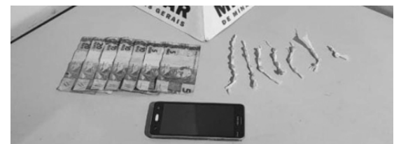
DROGA foi encontrada graças a informação recebida pela PM

A Polícia Militar prendeu, na última semana, um homem de 23 anos por tráfico de drogas em Rio Piracicaba. A corporação foi informada sobre o comércio ilícito no local conhecido como 'Trilho', no bairro Córrego São Miguel, e por