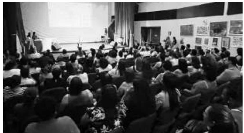
GRANDE público participou do evento na última sexta

A Associação de Pais e Amigos dos Excepcionais (Apae) de São Gonçalo do Rio Abaixo realizou, na sexta-feira (15), o 1º Encontro sobre Desenvolvimento Infantil sob o tema: “Compreendendo os desafios das síndromes e transtornos”. O evento foi realizado no Centro Cultural e contou com apresentações de dança e música pelos usuários atendidos pela instituição são-gonçalense.