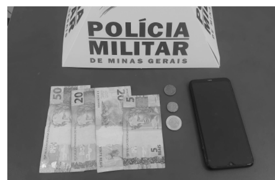
POLÍCIA recupera telefone celular furtado da cabine de caminhão e dinheiro da venda

Um homem de 40 anos foi preso por furto e uma mulher de 51 anos foi detida por receptação na manhã dessa quarta-feira (20) no bairro Cruzeiro Celeste, em João Monlevade. A vítima relatou à Polícia Militar que, por volta das 9h40, um ladrão furtou um telefone celular que estava na cabine de um caminhão, estacionado na avenida Armando Fajardo. Logo, os policiais iniciaram as buscas, encontrando