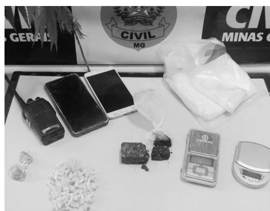
MATERIAIS ilegais foram apreendidos na casa de um dos alvos dos mandados