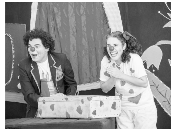
ESPETÁCULOS levam alegria e entretenimento aos cidadãos

O “Ler pra Valer em Todos os Cantos” visa aumentar o número de leitores em todas as regiões da cidade, além de incentivar o uso da Biblioteca, com a expedição da carteira de leitor para empréstimos de livros.