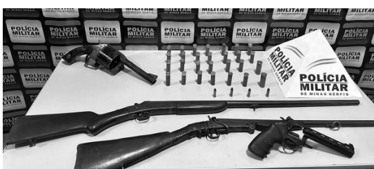
COM O FUGITIVO, foram encontradas várias armas

Após ser capturado, o foragido foi encaminhado à Delegacia de Polícia Civil para os procedimentos habituais. Ele era alvo de mandados de prisão por homicídio, tráfico de drogas, associação para o tráfico e corrupção de menores, expedidos pelas comarcas de João Monlevade, Ribeirão das Neves e Igarapé.