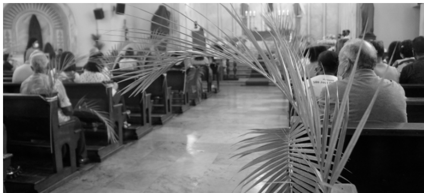
MISSA de Domingo de Ramos será celebrada em diversas igrejas