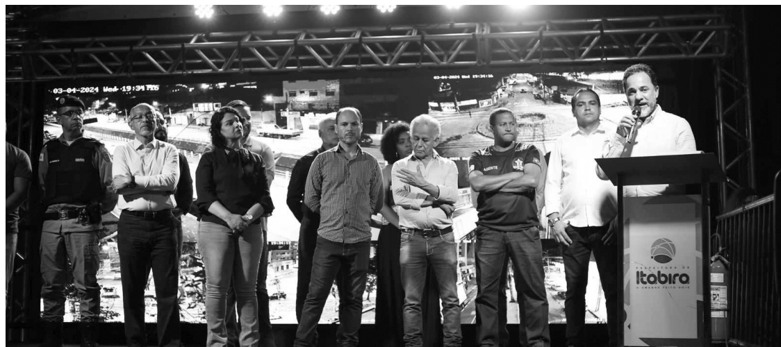
PREFEITO Marco Antônio Lage durante discurso junto a autoridades