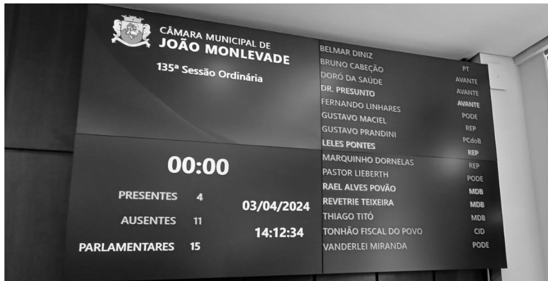
PAINEL de votação da Câmara já mostra novas configurações partidárias

Termina amanhã (6) o prazo para que os vereadores em exercício mudem de partido a tempo de concorrerem às eleições de outubro. Na Câmara Municipal de João Monlevade, a maioria dos parlamentares já encaminhou suas transferências, estampadas no painel eletrônico da Casa. Ao todo, 10 legisladores lutarão pelo voto do monlevadense com novas bandeiras.