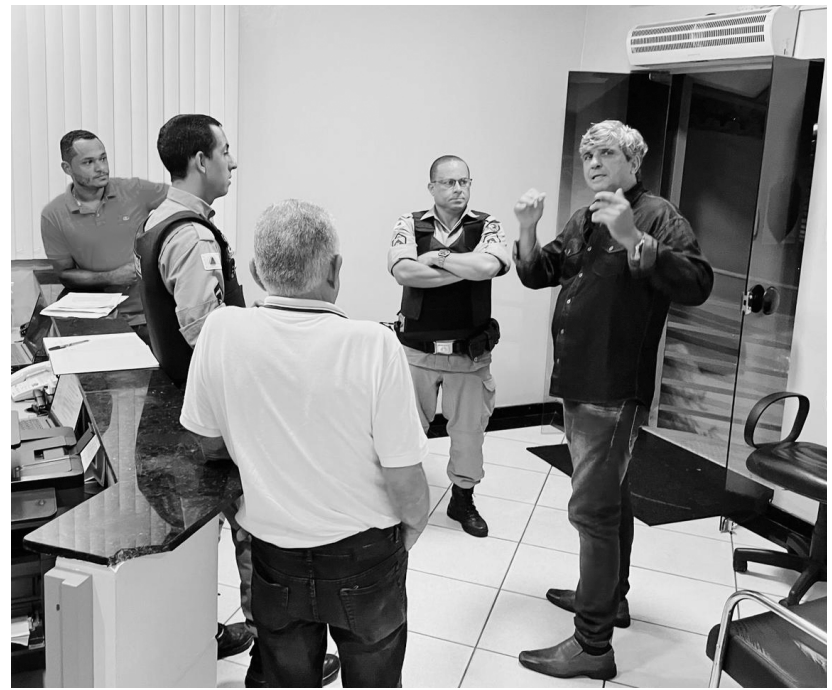
POLICIAIS conversaram com vereadores após a reunião