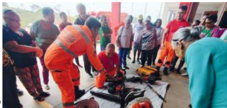
IDOSOS aprenderão a reagir em casos de emergência

No primeiro encontro, os participantes conheceram as dependências do quartel, experimentaram equipamentos utilizados pelos bombeiros militares e tiveram treinamento teórico e prático sobre como desengasgar um adulto, situação recorrente e perigosa para os mais velhos.