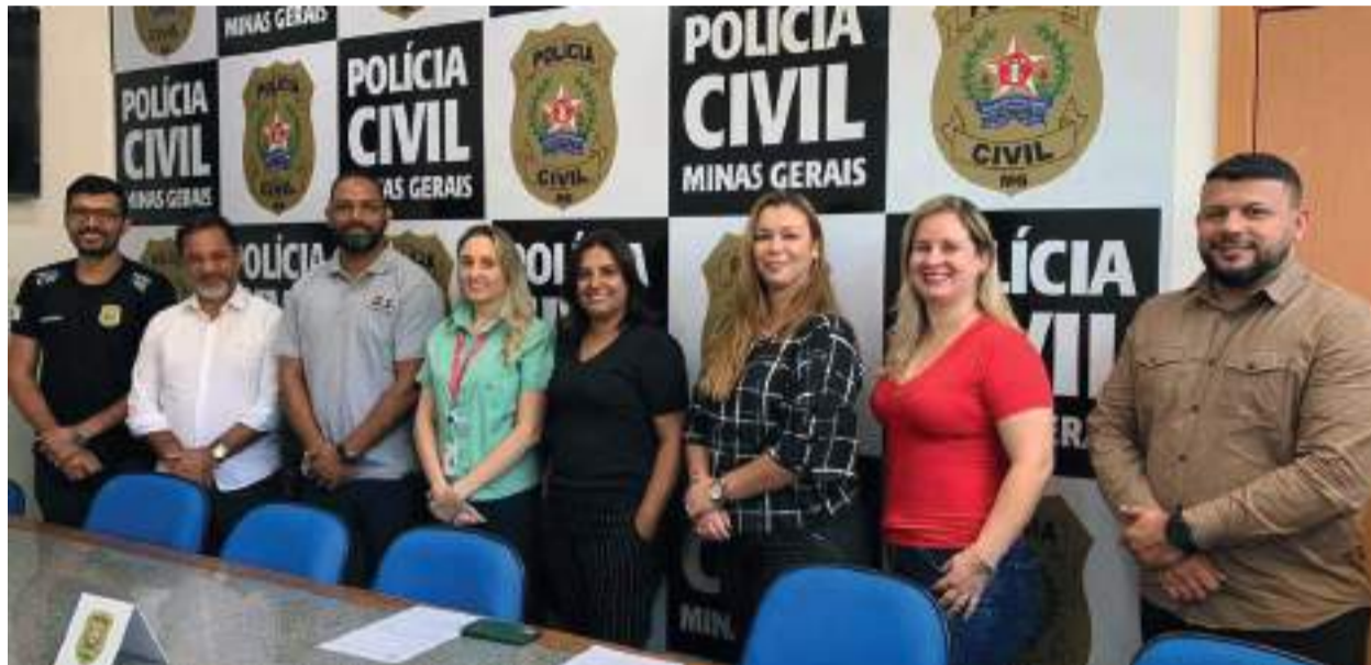
AÇÃO VISA proteger e dar garantias às mulheres que sofrem violência