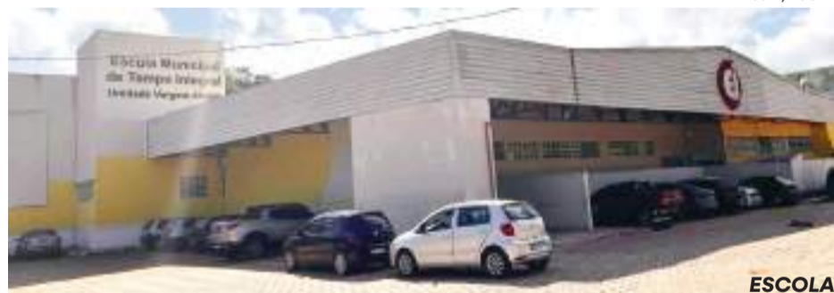
ESCOLA completa, em breve, uma década de atendimentos

A Escola de Tempo Integral de Vargem Alegre comemora, no dia 8 de junho, uma década de atendimento aos estudantes do Ensino Fundamental I de todo entorno da localidade. Para marcar a data, a Prefeitura de São Gonçalo do Rio Abaixo, por meio das secretarias de Educação e de Obras, realiza inves-