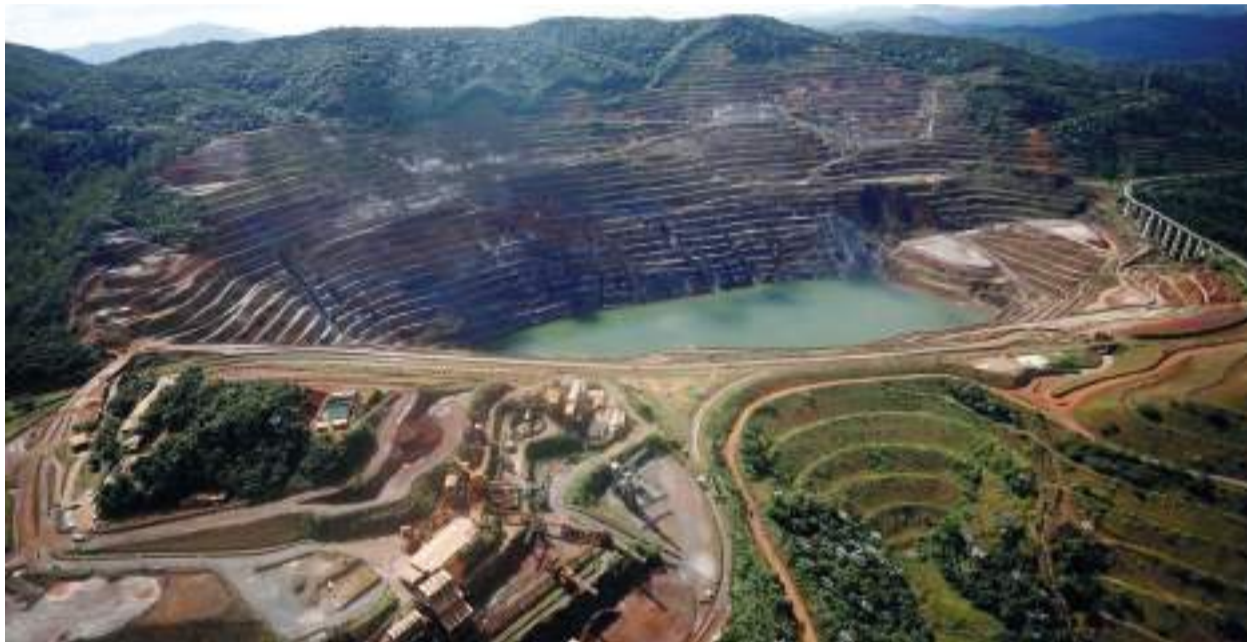
BARRAGEM Sul Superior está em nível 3 do Plano de Ação de Emergências desde 2019