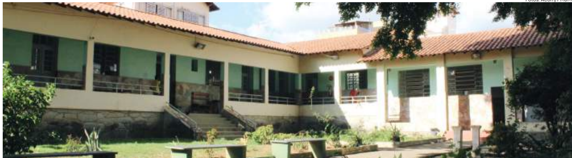
CASA DE APOIO fica no bairro Floresta, em BH, e oferece acolhimento a pacientes e acompanhantes

A Prefeitura de João Monlevade, por meio da Secretaria Municipal de Saúde, informa que já efetuou mais de 18.500 diárias de hospedagem de pacientes e acompanhantes na Casa de Apoio que fica em Belo Horizonte. O espaço funciona desde outubro de 2022 no bairro Floresta. Ela recebe usuários do Sistema Único de Saúde (SUS) em procedimentos médicos na capital mineira, além de seus acompanhantes.