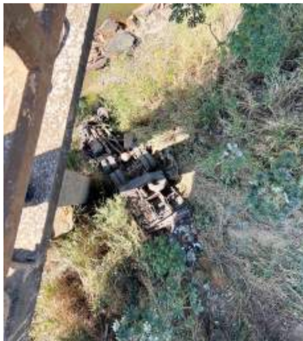
CAMINHÃO terminou com as rodas para cima

Um caminhoneiro morreu em um acidente na manhã de quarta-feira (29) na BR-262, próximo à entrada para São José do Goiabal. Por volta das 7h50, ele se aproximava da ponte sobre o rio Doce, no quilômetro 149, próximo à divisa entre Rio Casca e São Domingos do Prata. Segundo a hipótese mais provável, o condutor perdeu o controle do veículo.