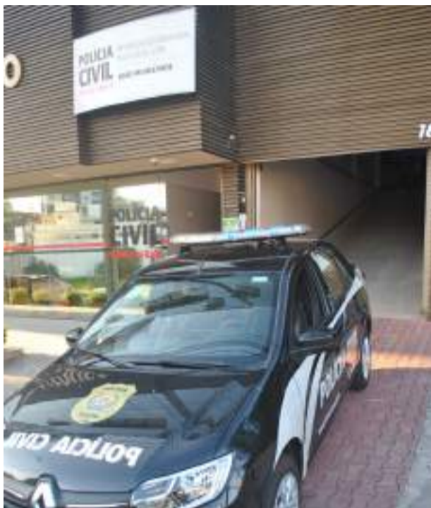
SEDE da Polícia Civil em Monlevade, responsável por 10 municípios

Os índices de violência sexual caíram no ano passado na Delegacia Regional de João Monlevade em relação a 2022. Números divulgados pela Polícia Civil dão conta que a 4ª Delegacia Regional, responsável por 10 municípios, registrou 13 denúncias de estupro em 2023, contra 14 no ano anterior, queda de 7,14%. Também melhoraram os indicadores de estupro de vulnerável, com 34 denúncias no ano passado, contra 37 em 2022, diminuição de 8,1%.