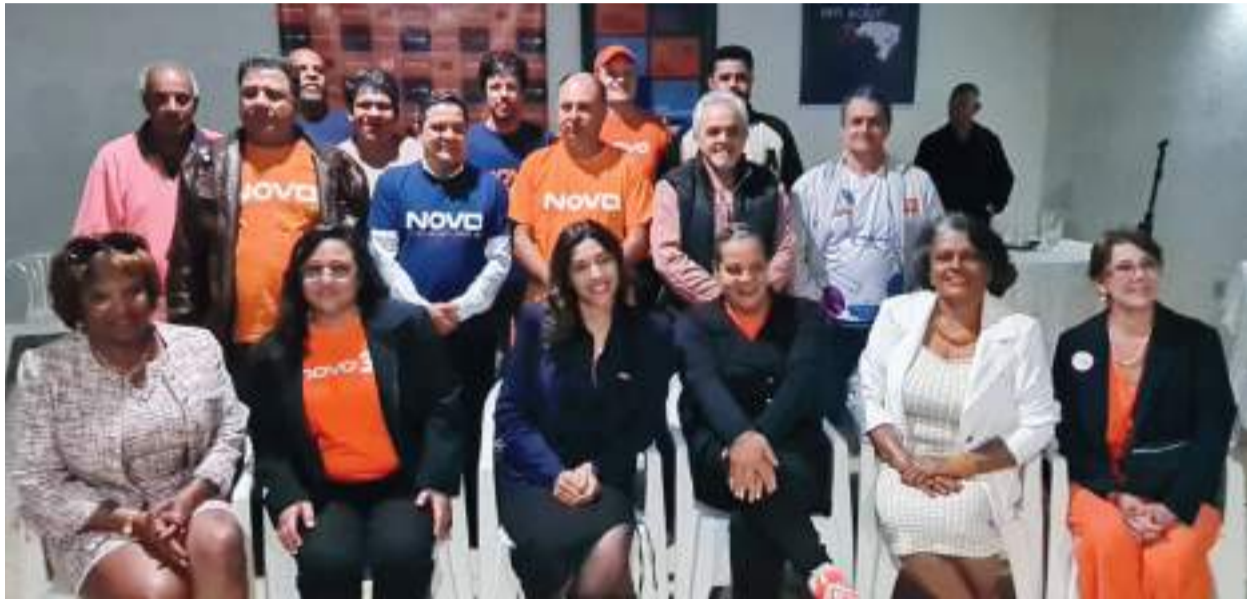
LIDERANÇAS e apoiadores do Novo durante lançamento na última terça-feira