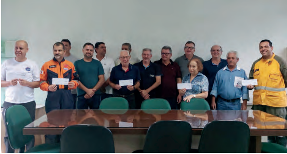
REPRESENTANTES do Clube do Cavalo e das instituições beneficiadas durante entrega de doações na última semana

O Clube do Cavalo de João Monlevade realizou mais uma ação beneficente para entidades da cidade. Na última sexta-feira (8), os voluntários repassaram doações a entida-