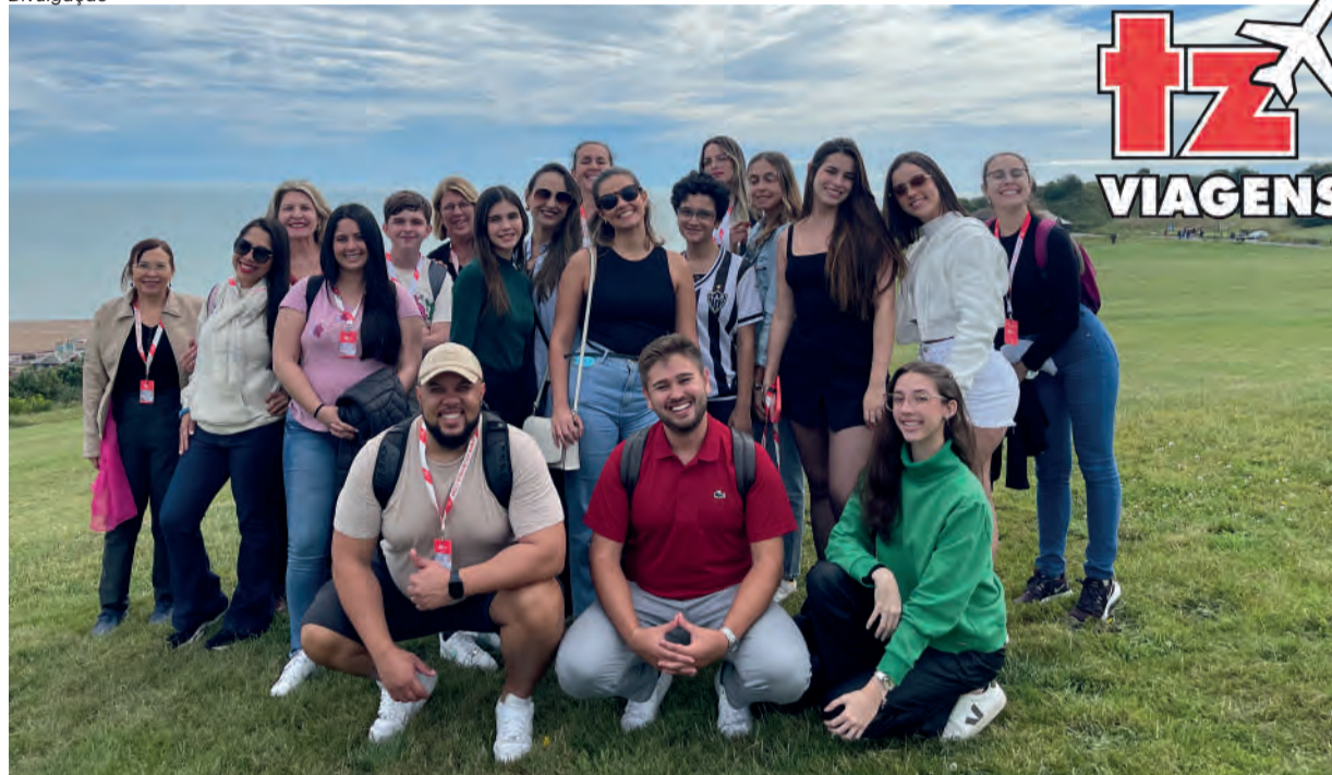
TURMA do último intercâmbio, realizado em julho de 2024 pela TZ Viagens

A TZ Viagens está organizando mais um intercâmbio com destino a Inglaterra, programado para julho do próximo ano. Restam as últimas vagas. Quem participar vai viver uma experiência incrível durante três semanas, com programação que inclui estudo da língua inglesa, além de atividades culturais e vários passeios pela Europa, incluindo visita a Paris e a Euro Disney.