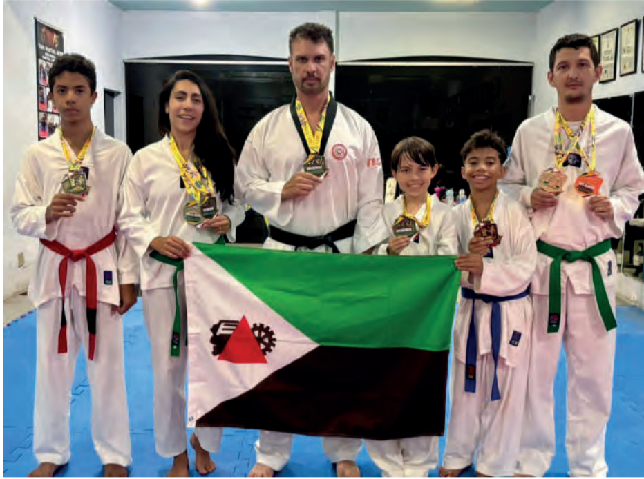
ATLETAS de Monlevade voltaram para casa com 9 medalhas